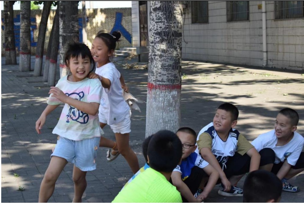
西南交通大学——“沐芽之旅”支教队——课间孩子嬉戏玩耍