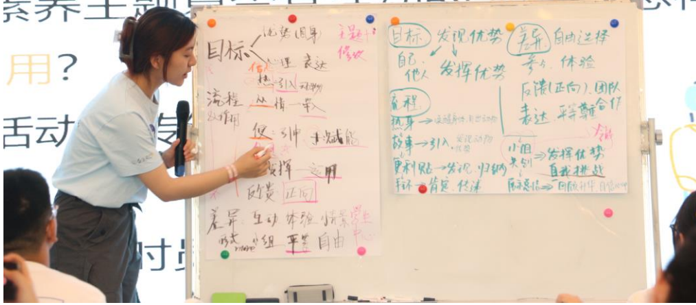
成都场线下培训瞬间

以小组为单位，讨论以下问题： 素养主题夏令营活动的目标是什么 素养主题夏令营活动的流程是怎样 用？