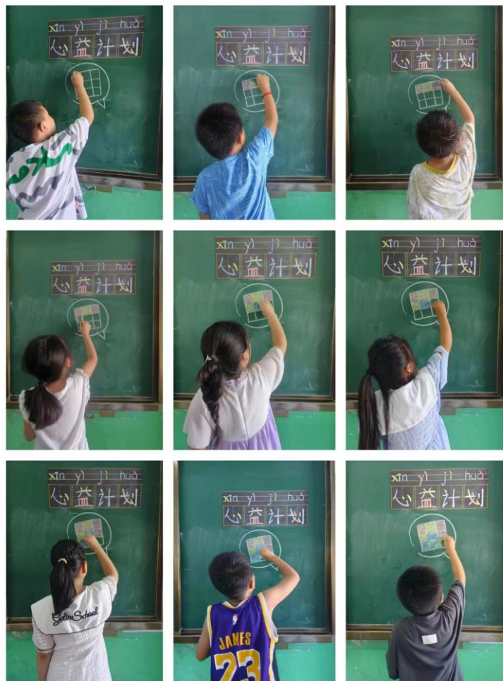
郑州航空工业管理学院——蒲公英支教队——《开营》课堂上学生与志愿者共创作