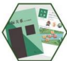
人际关系之冲突解决

课程以 培养同伴交往能力 为核心，通过游戏、绘画、表演等形式，旨在增强学生认识友谊、欣赏他人和积极倾听的能力，提升其友谊质量和同伴关系水平。