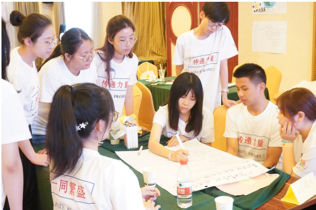
上海场线下培训学员讨论