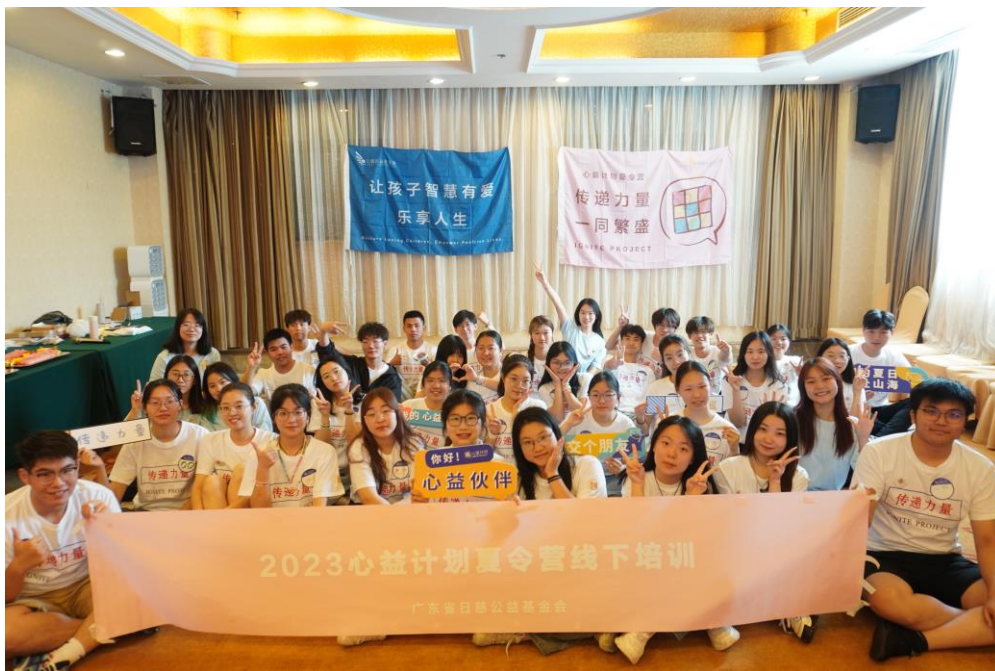
上海场线下培训合影

本次夏令营项目沿用往届夏令营模式,为大学生团队提供“心智素养主题课程包”,并提供相应的线上培训及线下培训,帮助大学生志愿者全面了解课程理念及重难点,更好开展课程。同时,日慈为主题营团队提供一定的活动经费,用于支付夏令营期间产生的交通、物料、餐饮等费用。