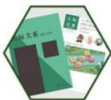
人际关系之建立友谊

课程以 培养情绪的觉察和处理能力 为核心，通过绘画、情景故事等形式，旨在增强学生对情绪的理解和觉察，提升其处理负面情绪的能力。