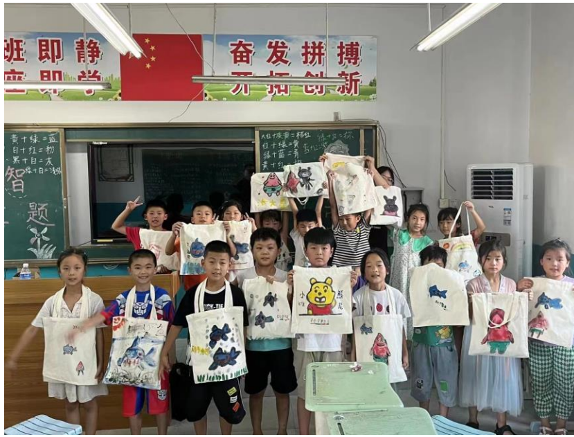
山东大学——向日葵暑期支教队——《认识自我》课堂上学生作品